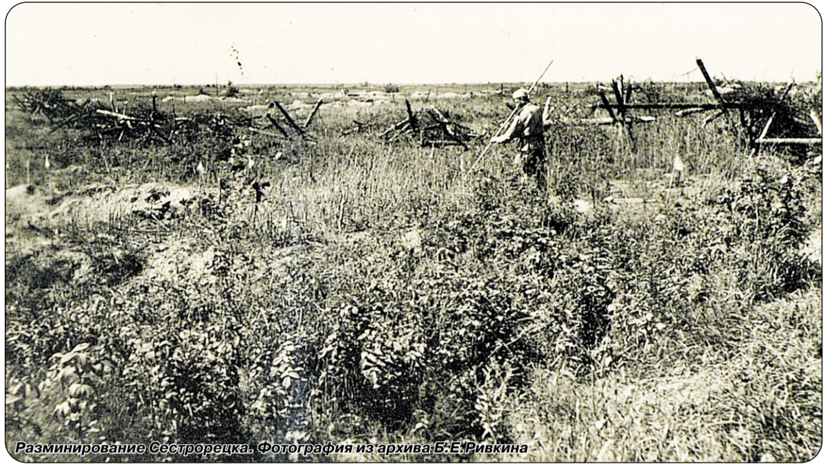
Разминирование Сестрорецка.

На этом же заседании было решено открыть первый после блокады детский сад в Сестроречке с количеством детей 100 человек. На заседании Исполкома отмеча-