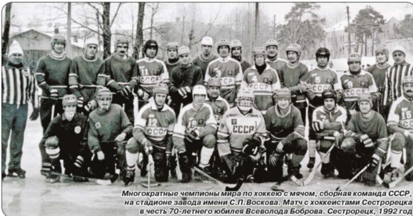
Многочисленные чемпионы мира по хоккею с мячом, сборная команда СССР, на стадионе завода имени С.П.Воскова. Матч с хоккеистами Сестрорецка в честь 70-летнего юбилея Всеволода Боброва. Сестрорецк, 1992 год