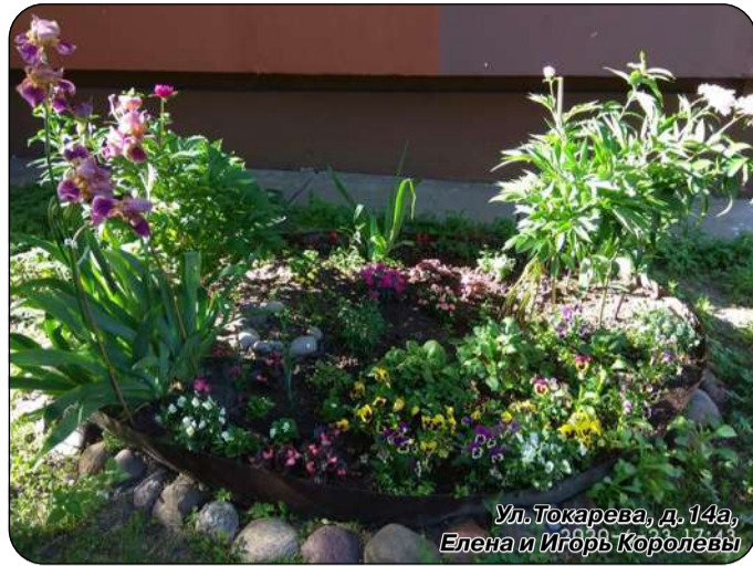
Ул. Токарева, д. 14а, Елена и Игорь Королёвы

На фото – цветники, созданные руками сестроречан