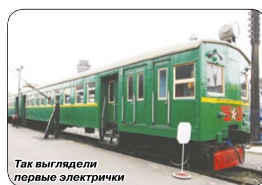
Так выглядели первые электрички

Зеленогорское направление было электрифицировано годом ранее – 4 августа 1951 года. Первые электрички были так называемые «тупоносые», марки См027 Мытищинского ВЗ, посадочные двери были с ручным приводом открывания,