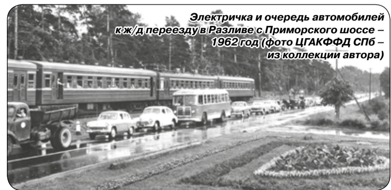
Электричка и очередь автомобилей к ж/д переезду в Разливе с Приморского шоссе – 1962 год