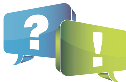
На ваши вопросы отвечают руководители района