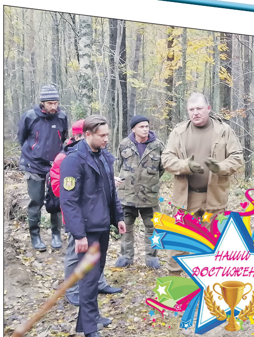
Люди, места и события 2019 года