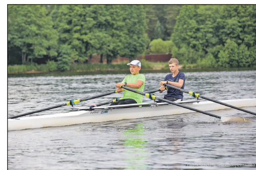
Спорт крутых аристократов