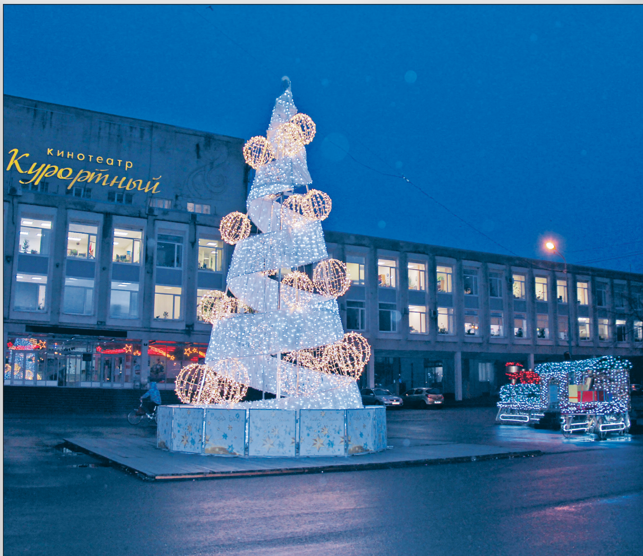
Программа новогодних и рождественских гуляний и анонсы праздничных мероприятий