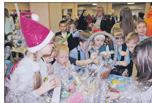
Школьная ярмарка зажгла «Огонек добра»