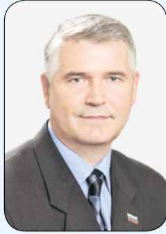
График приёма жителей депутатами Муниципального совета Сестрорецка

Второй и четвёртый понедельник каждого месяца, с 16.00 до 18.00 г.Сестрорецк, Приморское шоссе, д.280, литер А, помещение Муниципального совета г.Сестрорецка, тел.: 679-69-00