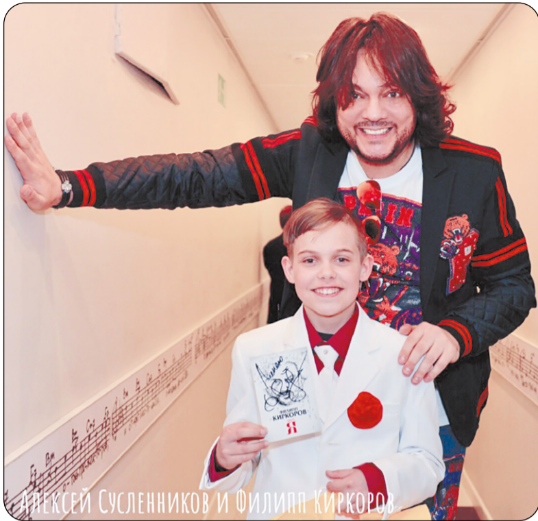
Алексей Сусленников и Филипп Киркоров