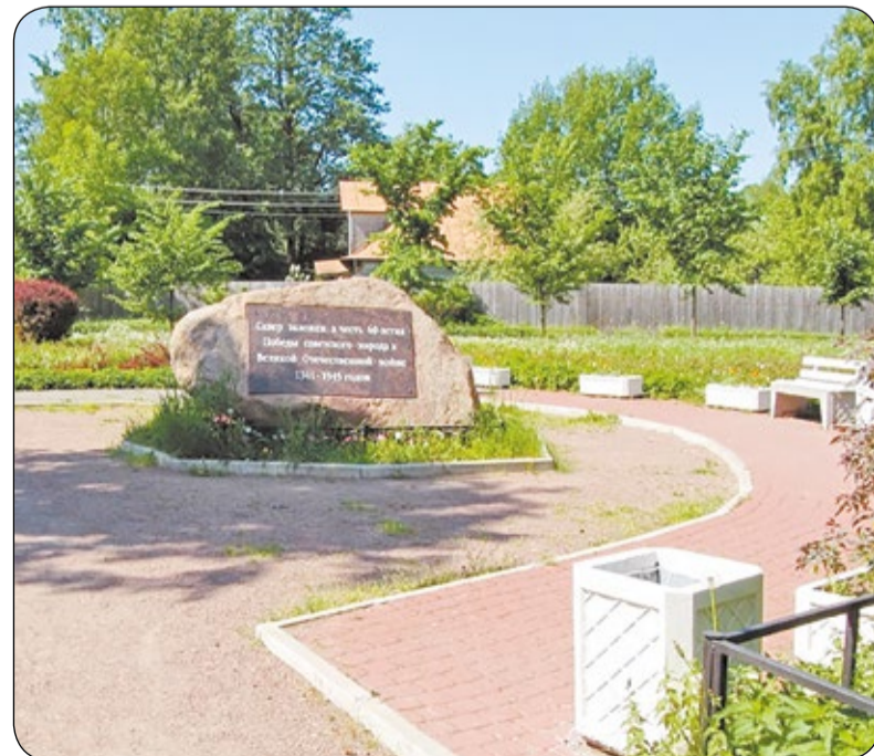
К 9 мая в сквере Непокорённых планируется установить табличку или стелу с его теперь уже официальным наименованием.