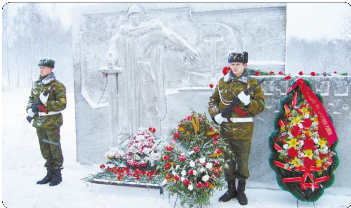
На праздничный салют пол-Ленинграда не поднялось, Рыдают люди и поют, и лиц заплаканных не прячут. Ю. Волков