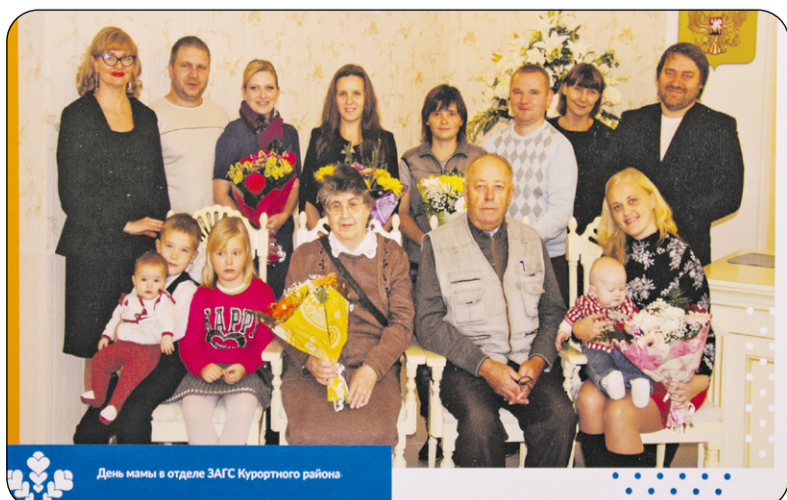
День мамы в отделе ЗАГС Курортного района

Материалы для выставки предоставлены редакцией нашей газеты, старейшей в Курортном районе Санкт-Петербурга. Специально для посвящённой Дню основания города Сестрорецка выставки были отобраны 30 фотографий с портретами семей сестроречан, отметивших важные