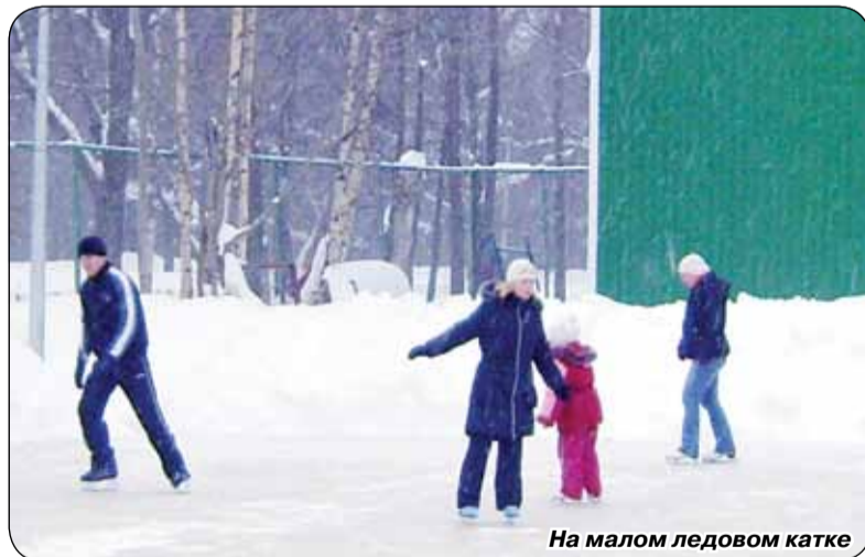
На малом ледовом катке

Для любителей лыжных прогулок оборудованы три отличные трассы, протяженностью 1,8, 2,5 и 5 километров. Можно приехать большой веселой компанией и пробежаться по одной из них наперегонки. Другой вариант – медленно пройти на лыжах, любуясь красивейшими зимними пейзажами петровского парка.