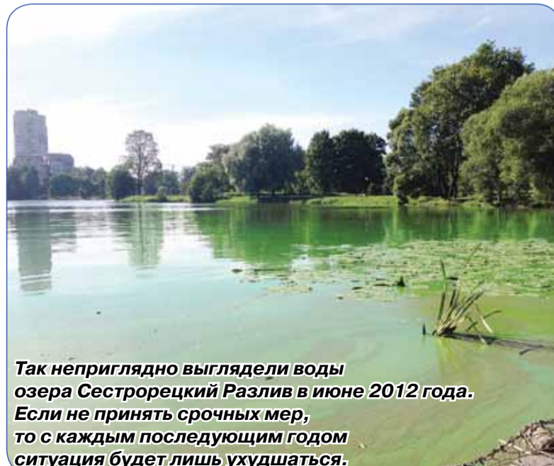
Так неприглядно выглядели воды озера Сестрорецкий Разлив в июне 2012 года. Если не принять срочных мер, то с каждым последующим годом ситуация будет лишь ухудшаться.