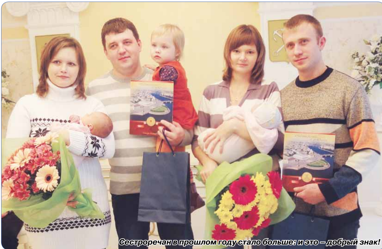
Сестроречан в прошлом году стало больше: и это – добрый знак!

Закончился високосный 2012 год. Он обещал нам конец света, глобальные мировые катаклизмы, взрывы, ураганы, смерчи – как в природе, так и на политической арене и в экономике многих стран мира. Что же на поверку?