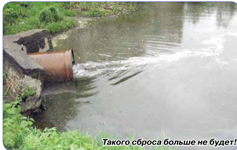
Такого сброса больше не будет!

Но для полного прекращения сброса неочищенных стоков в р.Черную необходимо провести реконструкцию существующего канализационного трубопровода от поселка Сертолово-2 к Главной