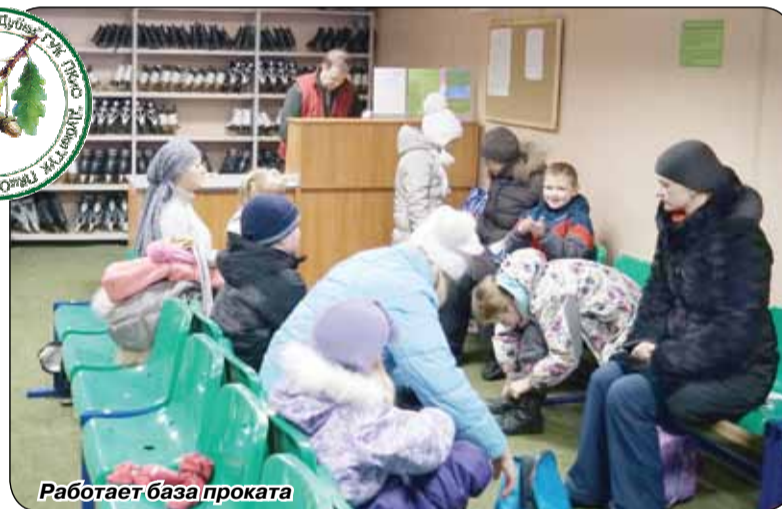
Работает база проката