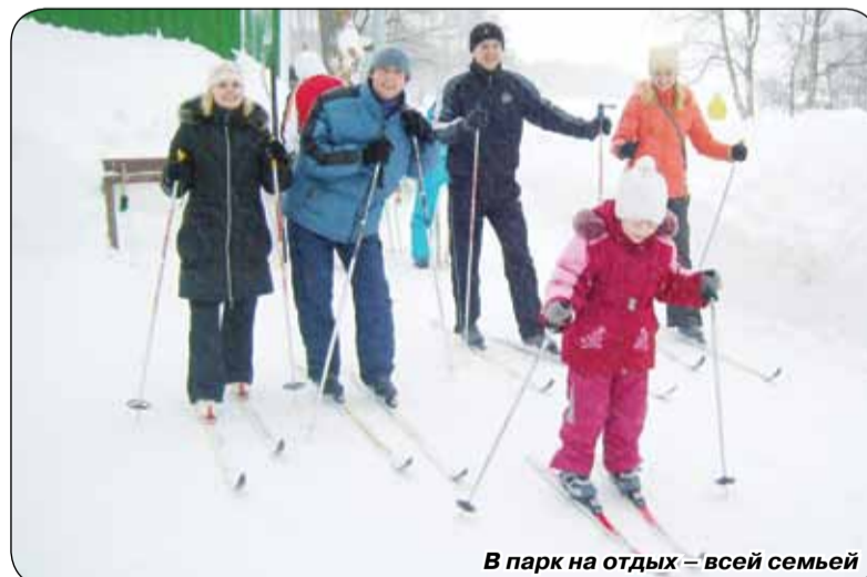
В парк на отдых – всей семьей

Кстати, лыжи тоже можно взять напрокат – качественные пластиковые, с современными ботинками и удобными системами крепления. Также у нас работает прокат финских саней. И конечно, – ватрушки, на которых так любят кататься дети. Ну а для тех, кто не может долго находиться на морозе – теплые раздевалки и горячий ароматный чай.