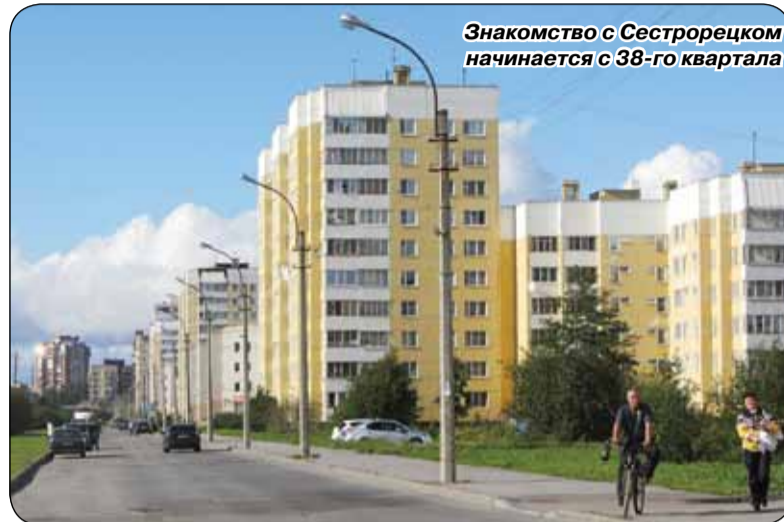
Знакомство с Сестрорецком начинается с 38-го квартала

На фото: так должен был выглядеть 38-й квартал