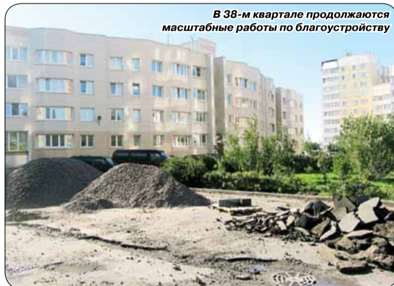
В 38-м квартале продолжают масштабные работы по благоустройству