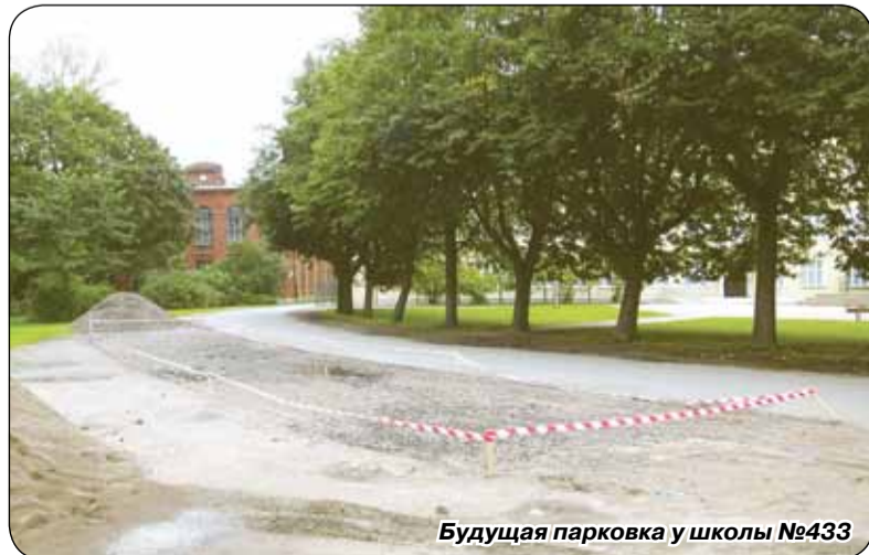
Будущая парковка у школы №433

Спасибо за то, что Вы неравнодушно относитесь к развитию нашего города!