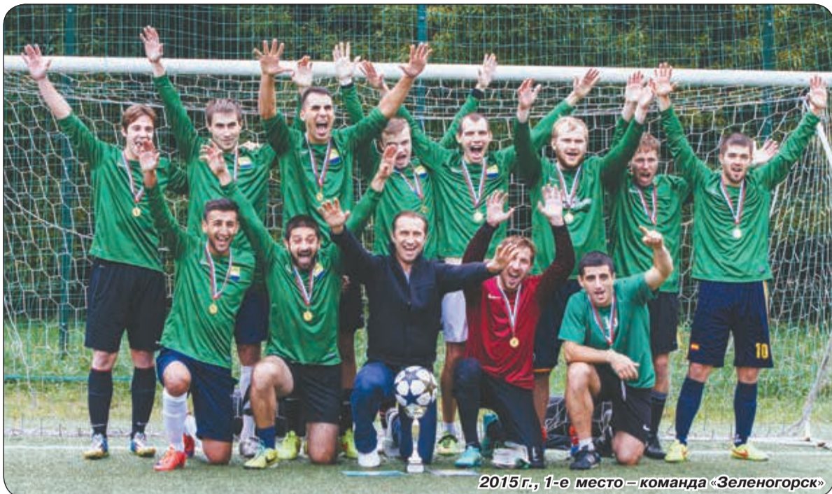
2015 г., 1-е место – команда «Зеленогорск»