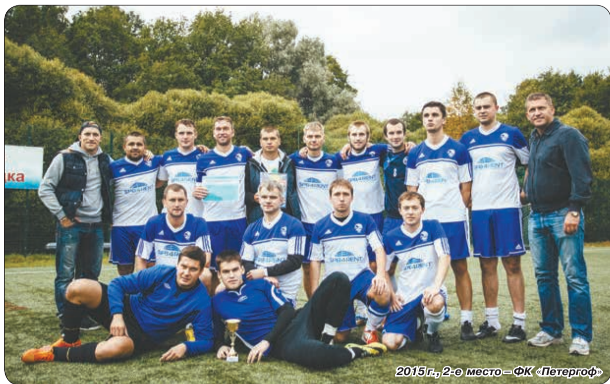
2015 г., 2-е место – ФК «Петергоф»