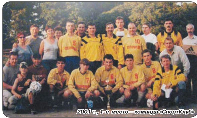
2001 г., 1-е место – команда «СпортКлуб»

Турнир продолжается, и не за горами его уже 17-й сезон!