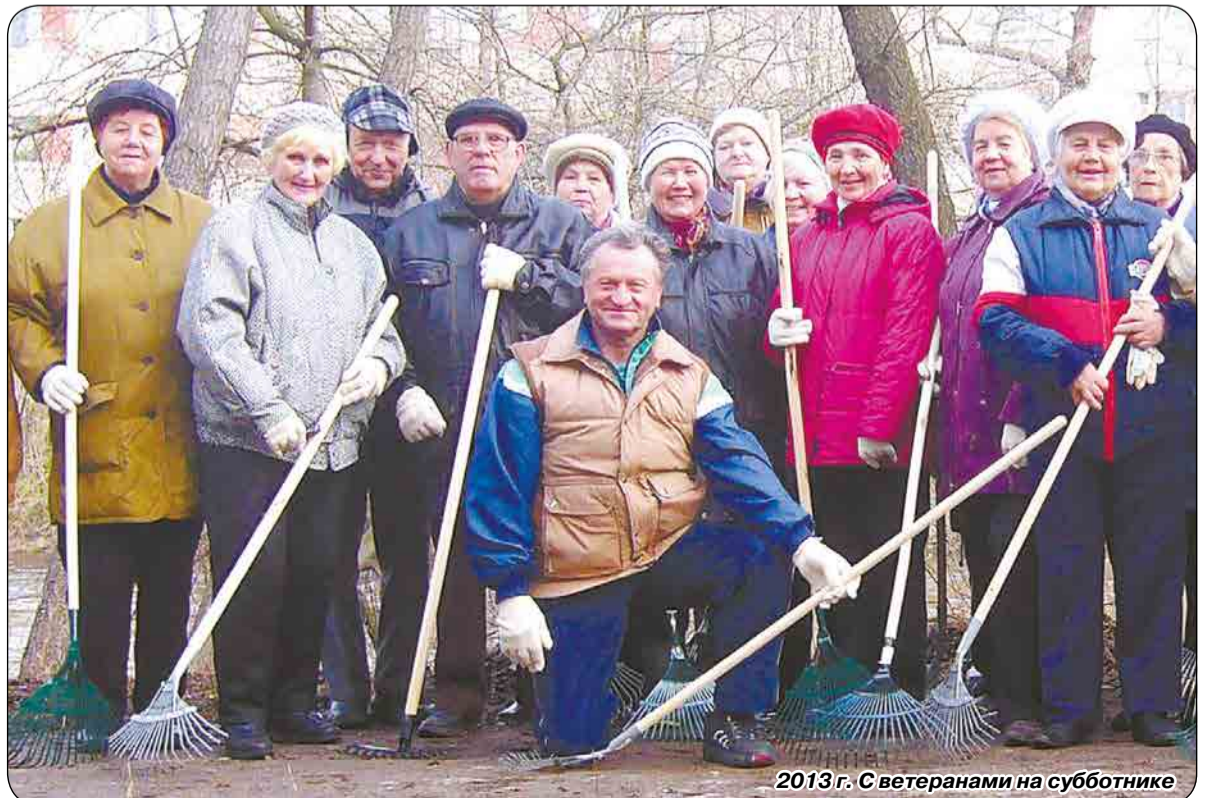
2013 г. С ветеранами на субботнике