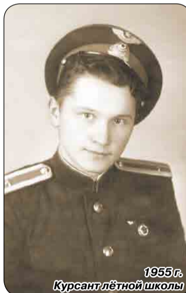
1955 г. Курсант лётной школы

Члены Президиума Совета ветеранов (пенсионеров, инвалидов) войны, труда, Вооружённых Сил и правоохранительных органов Курортного района