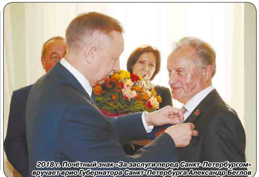
2018 г. Почётный знак «За заслуги перед Санкт-Петербургом» вручает врио Губернатора Санкт-Петербурга Александр Беглов