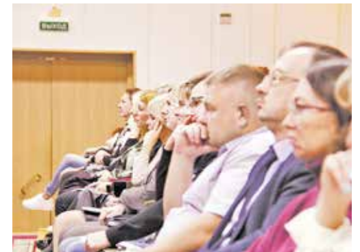
В районе прошли слушания по бюджету стр. 3