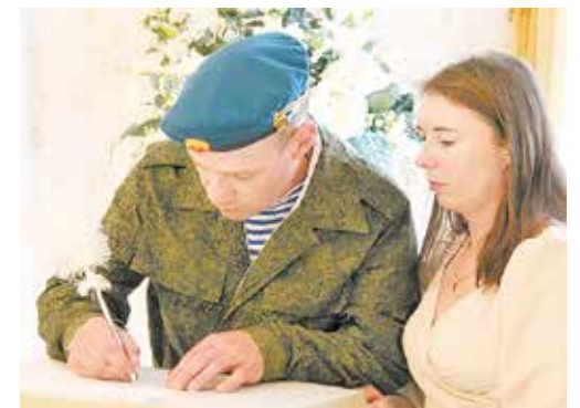
Свадьбы в военной форме стр. 6