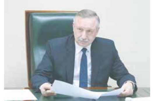
Александр Беглов о проекте бюджета Санкт-Петербурга «Районы. Кварталы»

В течение всего месяца специалисты коммунальных служб очистят дороги и улицы от мусора и листьев, починят и покрасят ограждения. А садовники высадят более 900 кустарников и несколько десятков деревьев.