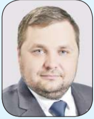
График приёма жителей депутатами Муниципального совета Сестрорецка