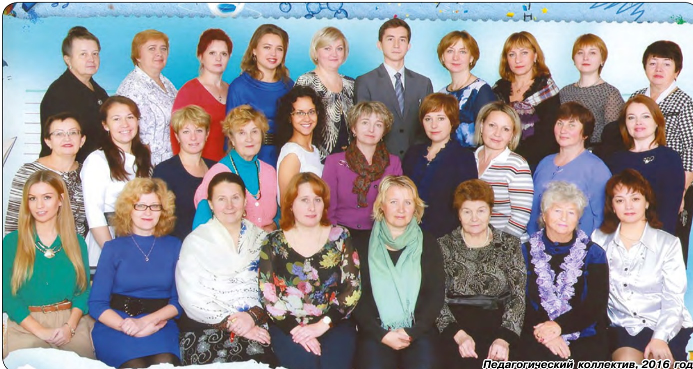
Педагогический коллектив, 2016 год