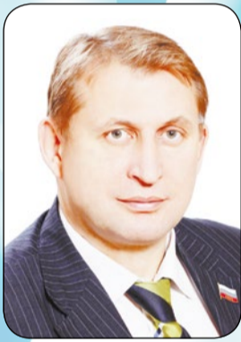
Депутаты Муниципального совета города Сестрорецка, сотрудники редакции газеты «Здравница Санкт-Петербурга»