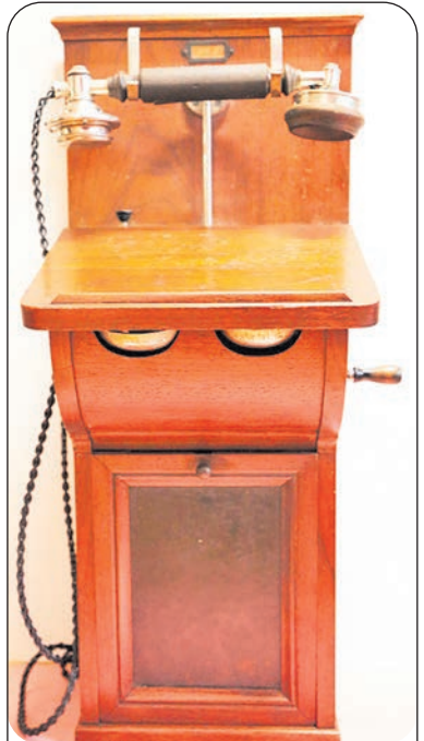
Аппарат телефонный настенный Telegrafverket конец XIX века. Коллекция Музейного комплекса в Разливе

тире Начальника завода. Но также: в трёх домах, занимаемых начальниками мастерских, в квартире Правителя канцелярии и по телефону в лаборатории, офицерском собрании, и местном лазарете.