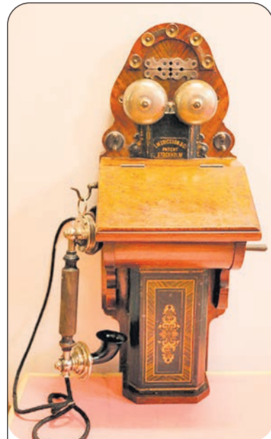
Аппарат телефонный настенный L.M. Ericsson & Co 1892 год. Коллекция Музейного комплекса в Разливе

Главному управлению Почт и Телеграфов уплачивалось по 25 рублей за каждый новый аппарат, а Правлению Приморской железной дороги – по 50 рублей. Если взять Ведомость об улучшениях, произведённых на Сестрорецком оружейном заводе за 1903 год, то на территории завода будут установлены телефонные аппараты не только в здании Правление Завода и в квар-