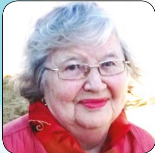
Родные, близкие и друзья

Больше половины жизни, целых 48 лет она работала учителем русского языка и литературы, затем – учителем начальных классов в школах Курортного района. Многие любят и помнят её как прекрасного человека и настоящего профессионала! Желаем крепкого здоровья, душевного тепла, долгих-долгих лет жизни!