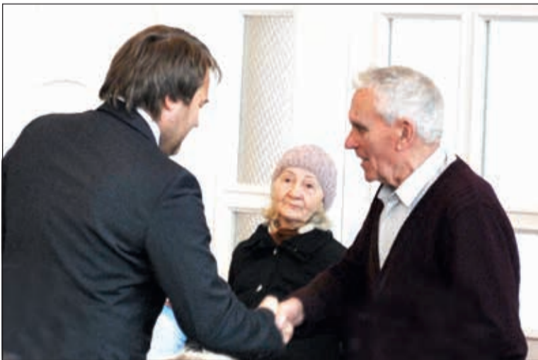
9 и 10 апреля в администрации Курортного района состоялось торжественное награждение ветеранов Великой Отечественной войны и жителей блокадного Ленинграда. Более 100 человек были награждены ме-