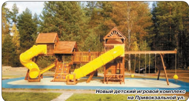
Новый детский игровой комплекс на Привокзальной ул.