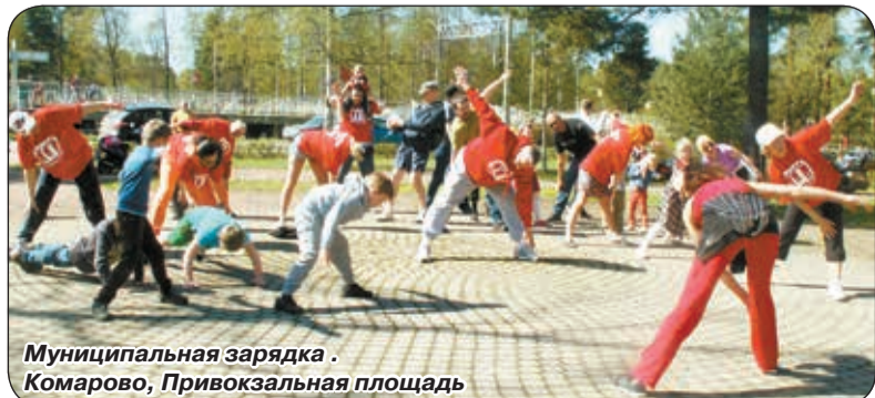
Муниципальная зарядка. Комарово, Привокзальная площадь