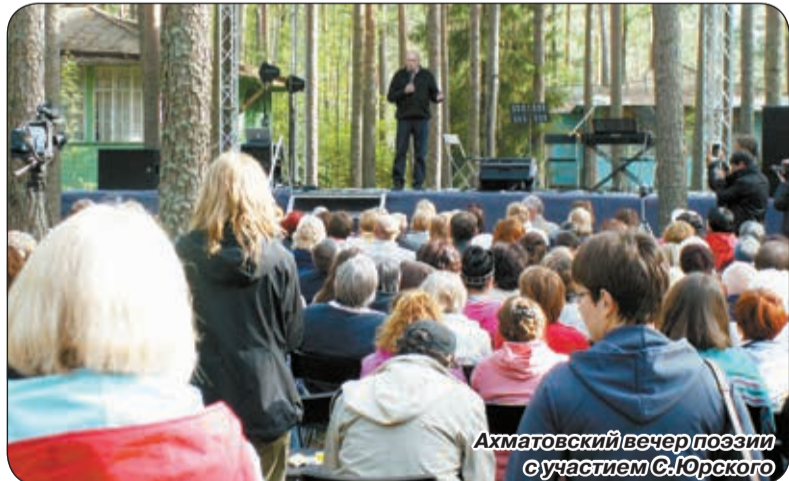
Ахматовский вечер поэзии с участием С.Юрского