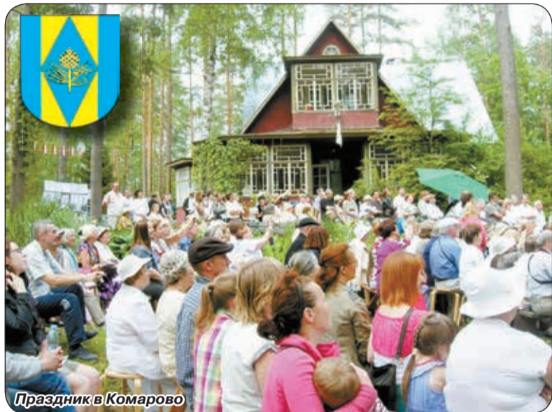
Праздник в Комарово