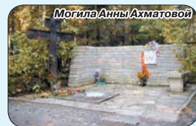
Могила Анны Ахматовой