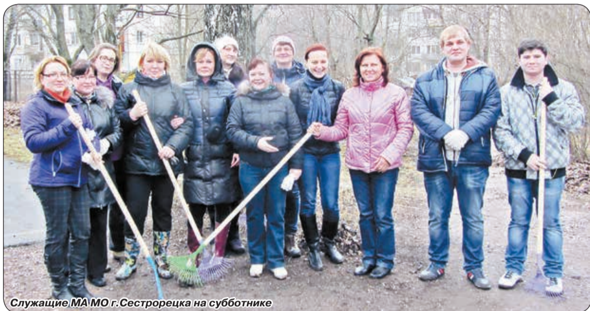
Служащие МАМО г.Сестрорецка на субботнике